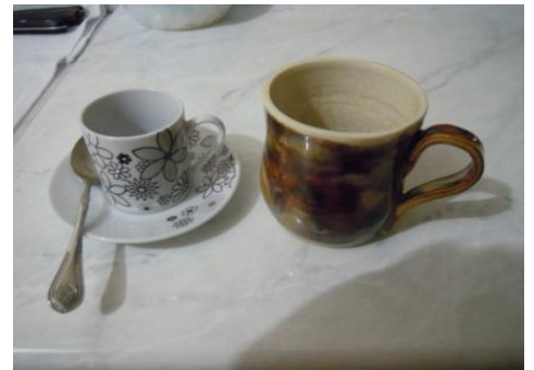
ブラジルによく見られるコーヒー茶碗（左側）

「ブラジル」と言えば、どんな国！？ 「サッカーとコーヒーの国…。」 遠い地球の裏側の国について知っていることは本当に少ない、ここで生活をしていて、心底そう思います。ブラジルは誰もが知るコーヒーの原産地です。ブラジル人は、毎日おいしいコーヒーを気軽に飲んでいると思いきや…。実は、本当においしいコーヒーは、大部分が輸出用に他国に送られてしまい、残った2番目、3番目ぐらいにおいしいコーヒーが、私たちが普段飲むコーヒーとして売られているそうです。私自身は、とてもおいしく飲んでいますが、「本当は、もっとおいしいコーヒーがあるんだよ。」なんて言われると、少し悔しい気持ちになります。ブラジルでのコーヒーの飲み方は、日本とは少し違った飲み方をします。一つは、コーヒー茶碗の大きさです。日本では、一般的に大きなマグカップにたくさんのコーヒーを入れて飲みますが、ブラジルで使われるカップはとても小さく、2～3口ぐらいすすると、すぐに空になってしまいます。コーヒーの味は、日本で飲むよりかなり濃く、最近は慣れましたが最初の頃はお湯で薄めないと飲めないぐらいでした。ブラジル人は、この小さなカップに入った濃い味のコーヒーに、信じられないぐらいの量の砂糖を入れて飲みます。さらに、コーヒーと一緒に砂糖たっぷりの甘いケーキやクッキー（こっちのお菓子は、何を食べても信じられないぐらい甘いです！！）を食べたりすることもあります。街にはいたるところにBAR（バール）という喫茶店があり、ブラジル人は、外出中に何度もBARなどに立ち寄り、コーヒーを楽しむそうです。そして、日本人のコーヒーの楽しみ方と決定的に違う点、それは「アイスコーヒー」がないことです。一度、ブラジル人に日本では暑い日には、コーヒーを冷やして飲み、暑い日に飲むと最高においしいよ、と紹介すると、眉をひそめて「信じられない！」と言われたことがありました。そして「あなたたち日本人は、暑いからと言って、味噌汁を冷やして飲みますか？」と言われました。その話を聞いて、なるほど…、と思わず納得してしまいました。