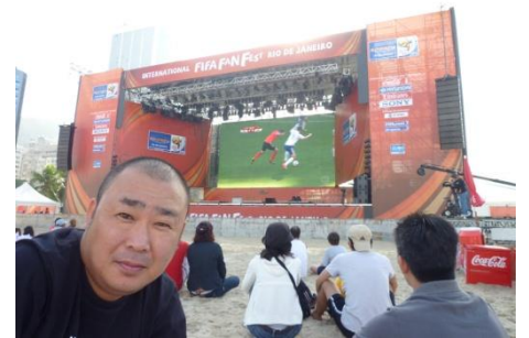
コパカバーナビーチの巨大スクリーン

バー!!（やったあ）」という叫び声が響き渡ります。そして、試合が終わると人々は一斉に街に繰り出し、その日の試合の話に花を咲かせるそうです。普段はのんびりしていて、あまり細かいことに気を止めないはずのカロオカたちも、ワールドカップの開催期間は人が変わってしまいます。試合の結果によっては、治安にも大きく影響すると聞いていたので、開催期間はなるべく外出を控え、安全に配慮しながら生活していました。そして、迎えた運命の準々決勝、対オランダ戦。ブラジル代表は惜しくも敗れ、2010年ワールドカップは幕を閉じました。しかし、「これで街のようすは元に戻る!？」と思いきや、人々