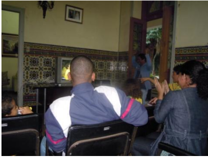
日系協会で試合観戦するブラジル人

ル人にとっては、常識的な行動なのだそうです。現地の学校も、休校にしたり、時間を短縮（午後から放課など）したりしながら、試合の時間に授業をしないようにしています。そんな状態で、ブラジル代表の試合の日は、街中のお店のシャッターが閉まり、リオの街から車や人の姿が消えます。私たち日本人学校も、