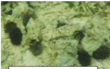
黒いのは、全部ウニ