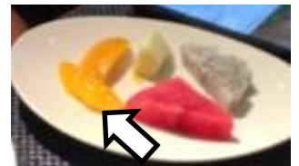
このマンゴーがとにかく 美味しいのです。

とにかく魚天国。潜らなくても上のような写真が撮れます。 約200の海洋生物を保護しているこのホテル。4歳の息子も腰 あたりの深さにも魚がたくさん。透明度の高さが抜群です。