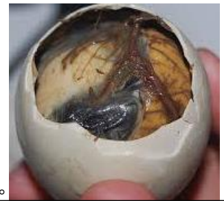
顔の形があるものもあります。

皆さん、バロットってご存知でしょうか?別名、ホピロン。(ベトナムの呼び方)この食べ物、私が愛読していた「美味しんぼ」という漫画に出てくるアヒルの卵のゆで卵です。ただ普通と違うのが、アヒルが孵化しかけていること。すごく前から興味があったのですが、フィリピンに来てコンビニで売っていてびっくりしました。これをフィリピン人は、たっぷりのお酢をかけて一気に食べます。先日、私も挑戦をしてみました。比較的、孵化しかけていないのを選んでもらっても割ると右の写真です。開けた時のスープはかろうじて飲めました。が、一口食べた時に毛のような触感があった瞬間ギブアップです。それを見ていたローカルのスタッフが大笑。残りをパクリと食べてしまいました。