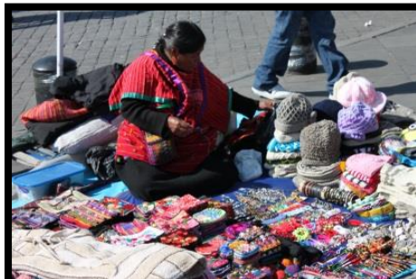
道端で品物を並べます

露店商 観光地に行くとき、民芸品などを路上に広げている人をよく見かけます。私もポシエットや笛などを買いました。値札がついていないので、値切りの交渉も楽しみの一つです。