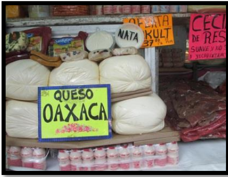
チーズもおいしいです

メキシコでは街のいたるところで市場（メルカド）が出ます。何曜日に出るかはメルカドしだいですが。私も近所のメルカドで新鮮な野菜や果物を買います。