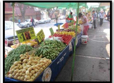
新鮮な野菜はメルカドで！