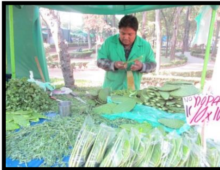
サボテンも売っています