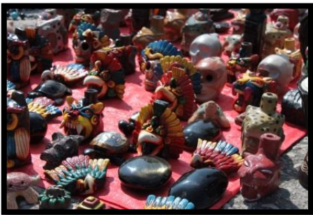
ジャガーやワシの笛