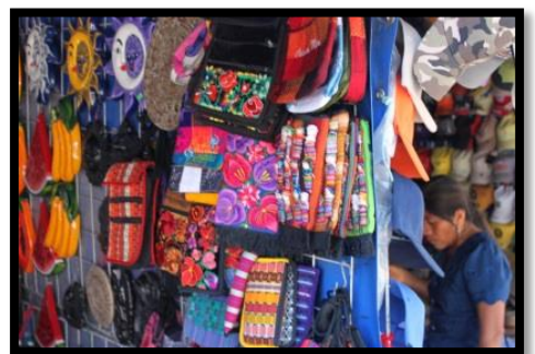
色鮮やかなポシエット

路上販売・サービス 渋滞の多いメキシコでは、信号待ちの車を相手に物売りや窓拭きのサービスを行う姿をよく見かけます。 スナックやガムなどのお菓子などはもちろん、クリスマスなどの行事に合わせたグッズも販売しています。